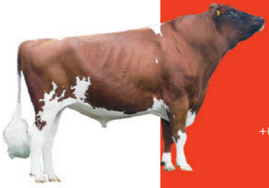
Andy Red 781489

Beenwerk 107 / Totaal Exterieur 106 +0,32% Vet / +0,06% Eiwit 918 Kg Melk / Geboortegemak 104