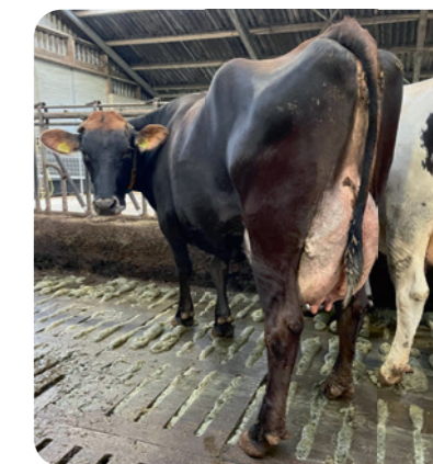
Brown Swiss topper uit Eibergen