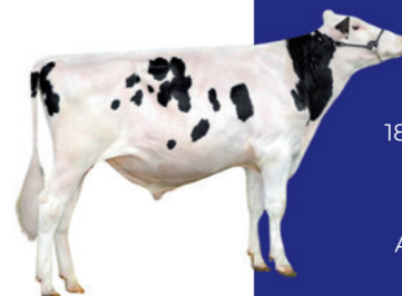
Remover PP 783859

+0,10% Vet / 0,02% Eiwit 1848 Lbs Melk / Inhoud 1,49 Achteruierhoogte 2,45 / Achteruierbreedte 2,36 Achterspeenplaatsing 0,81