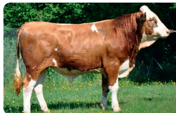
De stier Walygator

Hokuspokus bewijst dat een strak aangehecht, compact uier niet in de weg hoeft te staan van hoge producties. Zijn dochters laten een flinke melkplas zien, zijn probleemloos in de omgang en vallen nauwelijks op in de stal – totdat je naar hun prestaties kijkt. Ze groeien wat groter uit en zijn minder rond dan de typische Fleckvieh, maar hun rustige karakter en productiekracht maken ze een waardevolle aanvulling op elk bedrijf.