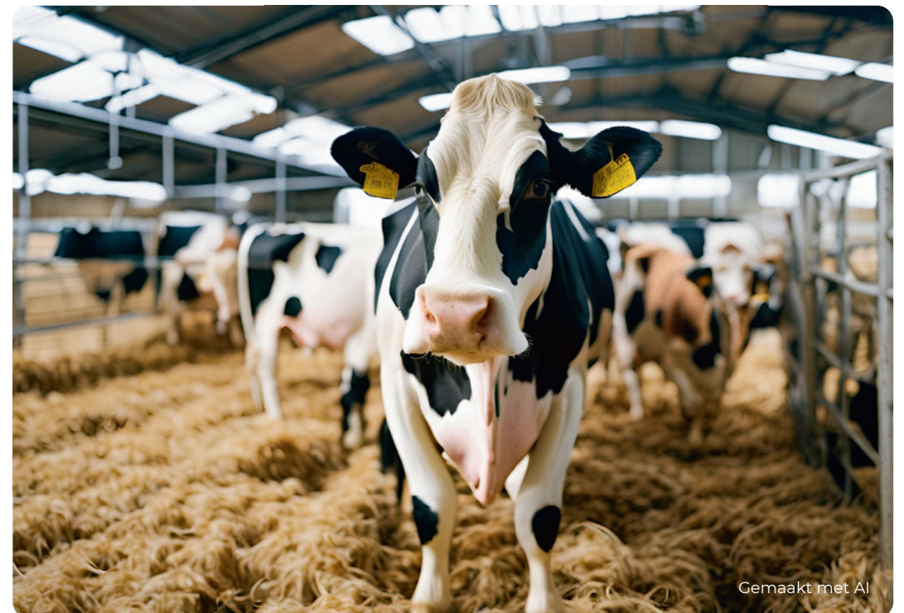
Gemaakt met AI