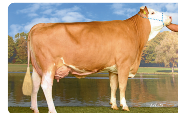
Hokuspokus Wisky 2e kalfs 40,5kg dag

Bij FertiPlus geloven we in de combinatie van slimme analyses en praktijkervaring. Met ons paringsadvies zorgen we ervoor dat de beste stieren op de juiste manier worden ingezet voor het meest optimale resultaat. Of het nu gaat om bewezen stieren zoals Walygator en Hokuspokus, of om veelbelovende genomicsstieren als Hrdobec, Hardcore PP en I am PP. Fleckvieh blijft daarmee dé keuze voor veehouders die willen bouwen aan duurzame, probleemloze koeien met een goed dubbeldoelrendement.