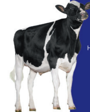
El Grande 784276

Hoogtemaat 0,41 / Voorhand 0,42 +0,14% Vet / +0,07% Eiwit 1370 Lbs Melk / TPI +2960 Achterspeenplaatsing 0,62 SCE = 2,0 / aAa 516