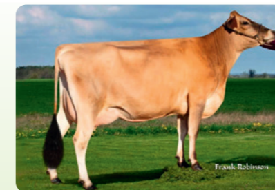
Zodi moeder (fokstier)