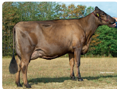
Brown Vigor dochter