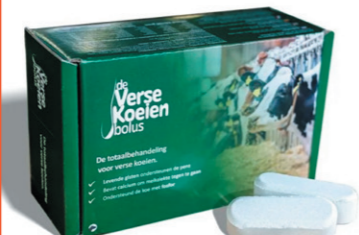
De Verse Koeien bolus De Verse Koeien bolus is een aanvullend diervoeder dat ontwikkeld is om de diergezondheid van de verse koe te ondersteunen na het afkalven.