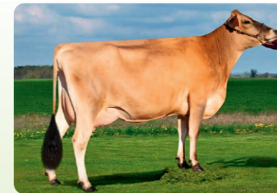
Zodi moeder (fokstier)