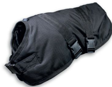
Kalverdek Premium 80cm Extra warmte voor het kalf met de kalver body-warmer met extra sterke riemen en gespen