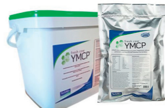
Techmix Fresh Cow YMCP Compleet supplement voor pas afgekalfde koeien met gist, magnesium, calcium, kalium en niacine voor een gemakkelijke en snelle transitie van droogstand naar lactatie