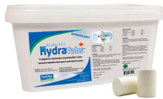
Techmix Bluelite C Hydra Tabs Smakelijke orale rehydratie voor jonge kalveren in de vorm van een bruis-tablet. De juiste dosering zonder meten, wegen of roeren