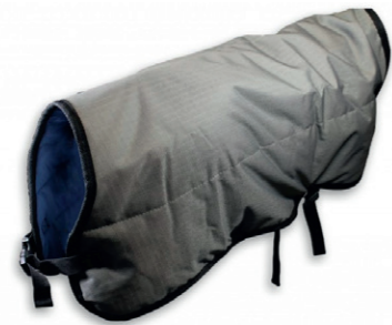
Kalverdek 70/80cm Bescherm uw kalf tegen temperatuurschommelingen