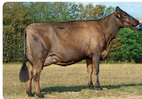
Brown Vigor dochter