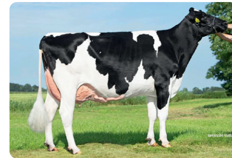
Andy Red dochter