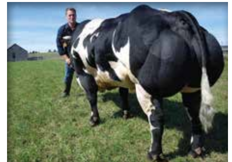
GENERAL de l'Ecluse

Zoon van General en niet zo maar één. Coca is een heel complete stier met veel finesse, klasse en ronde rib. Hij komt van een uitstekende moederlijn. Zijn moeder woog 571 kg geslacht op amper 3 jaar en had een eindbeoordeling van 88,6 punten.