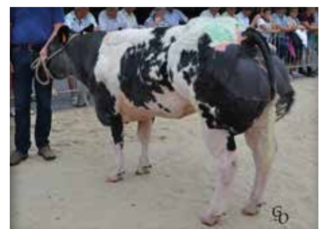
IDOLE van de Stokerij