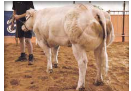
LIBERTE du Fond de Bois, demi-soeur de / halfzus van Juliana