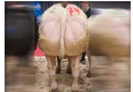
FETICHE de Warichet

Herbage is een stier met veel kwaliteiten. Deze voormalige kuddestier is een echte vleesstier die heel breed inzetbaar is. Herbage heeft een heel brede voorhand met veel finesse en type.