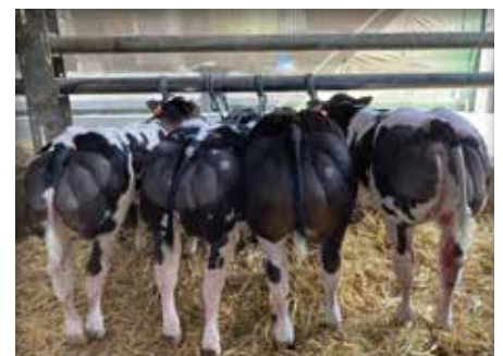
Lot chez / bij Deschuyteneer Agri, Bever