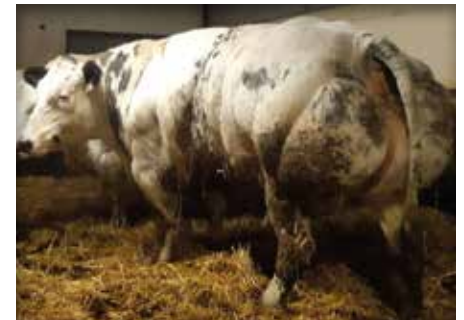
VERANDA de Glaumont