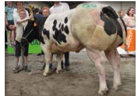
KIMO van het Caloenhof

BENHUR du Champ Bouval EMERAUDE van de IJzer ADAJIO de Bray DELUGE van het Caloenhof