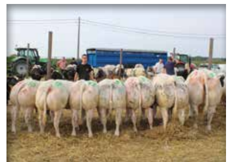
CAGNOTTE et ses descendants / en haar nakomelingen