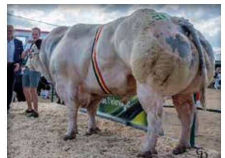
CACTUS du Moligna, propre frère de / volle broer van CASTOR du Moligna