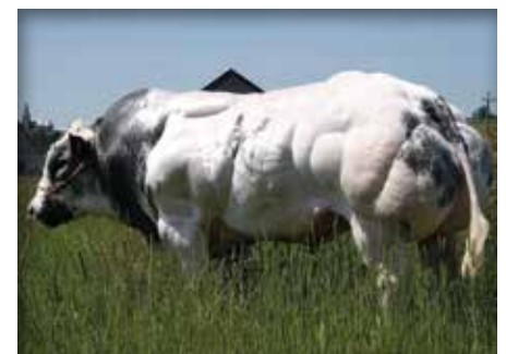
HERBAGE de Warichet