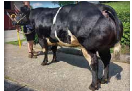
CHELSEA du Champ du Moulin