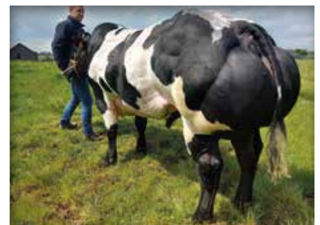
MARADONA du Champ de Moulin