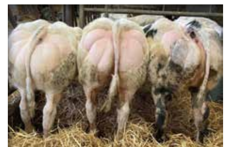
Lot chez / bij Vandebecq Guy, Thieu