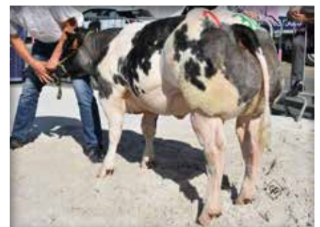
Fille de Ocean, 1 ère Erpe Mere