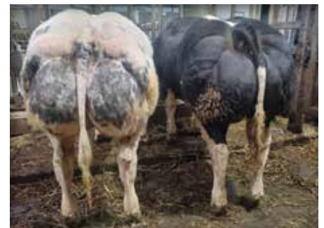
Lot chez/ bij Roggen-Schotsmans LV