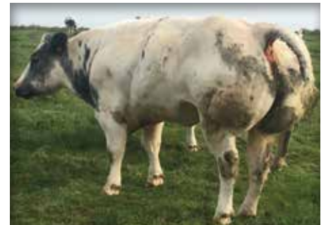
TYPIQUE de Roupage