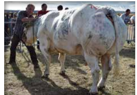
NAGEUSE du Panorama

Baryton is geboren op een bedrijf waar de opfokkwaliteiten heel belangrijk zijn. Dit voormalig zoogkalf was al het 5 de eigen kalf van een hele zware en mooie koe, Nageuse behaalde een 1 ste plaats in Etalle 2016 bij de koeien en de raceuses. Zijn pedigree laat een breed gebruik toe. Zijn finesse, type, karakter en kleur maken van hem een interessante stier.