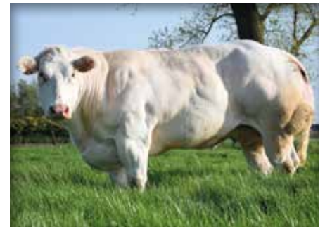
OCTAVIE van de Sijsloberg

Men kan gerust stellen dat Rufus veel referenties heeft. Zowel zijn pedigree als hijzelf is er één met heel veel gewicht en gestalte, ook zijn aparte bloedvoering valt op ! Vooral zijn voorhand, ronde schouder en brede rug zijn de grootste kwaliteiten van deze grote en lange stier. Zijn Moeder Octavie is een Arlequin-dochter van 1m40 met finesse. Zijn grootmoeder is niemand minder dan Riewke van Sijsloberg, bekende koe in het keuringsmilieu en afstammeling van Kora en Egalée du Coin.. De economische kwaliteiten van zijn nakomelingen maken van hem een veelgevraagde stier!