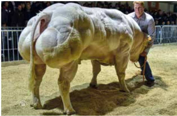
Couleur palettes - Kleur rijsjes nieuwe