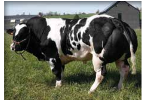
NOTAIRE du Tordoire

Echte kuddestier, Notaire is een lange en fijne stier met een geweldige voorhand. Zijn moeder en grootmoeder wogen meer dan 650 kg geslacht. De eerste kalveren bij de verkoper geven veel voldoening, het zijn gemakkelijke kalveren met veel finesse en groei.