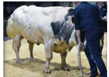
INSOLENT de St Remacle