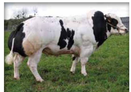
BARYTON du Panorama

OSCAR d'Omal 88 • 89,5 • 86,1 • 94 • 85 • 89,7