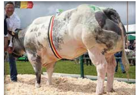
MIMOSA du Haut d'Arquennes, demi-soeur de / halfzus van PANAMA des deux Bouleaux

PANACHE de Centfontaine FUSEE du Haut d'Arquennes