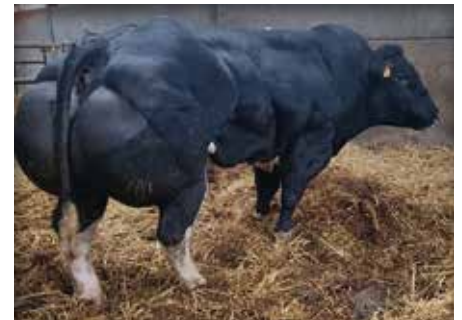
OCEAN Van Terbeck

Ocean is de eerste zoon van de populaire Lego op een KI, hij is een echte heel goede vleesstier met uitermate veel soort, veel lengte en een uitzonderlijke achterhand. Zijn moeder is een uitstekende dochter van Picadilly en zijn grootmoeder is de gekende Anna van Terbeck, 1 ste Nationaal Libramont 2007 en tentoongesteld op Agribex 2007 en Libramont 2008. Zij was een uitzonderlijke fokkoe die meerdere dochters van +1000 kg gegeven heeft. Zijn nakomelingen zijn heel vitaal en met een uitzonderlijke finesse en achterhand.