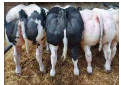
Lot chez / bij Pirson Pol, Schaltin