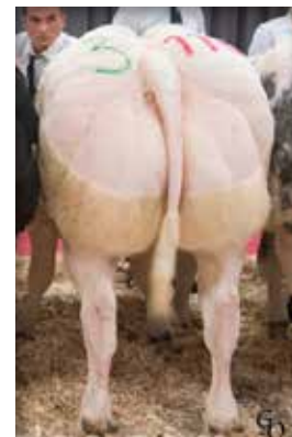
GALERIE de Biert, propre soeur de / volle zus van Irish Coffee