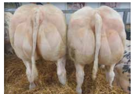
Lot à/in Libramont 2022