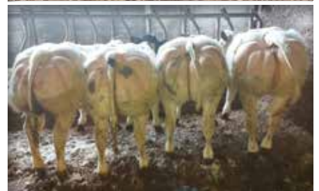
6 premiers veaux chez l'éleveur / 6 eerste kalveren bij de fokker