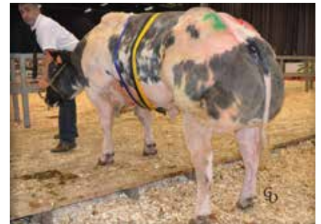
BARYTON de St Remacle

Insolent is een goede combinatie van gemakkelijke bloedlijn en opfok. Zijn grootmoeder is een halfzus van Baryton de St Remacle, provinciaal kampioen in Ciney en 2 de prijs Agribex. Insolent is een complete stier met type, lengte en veel finesse.