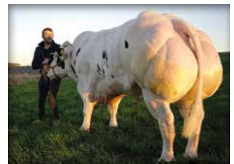
MARLO van het Caloenhof