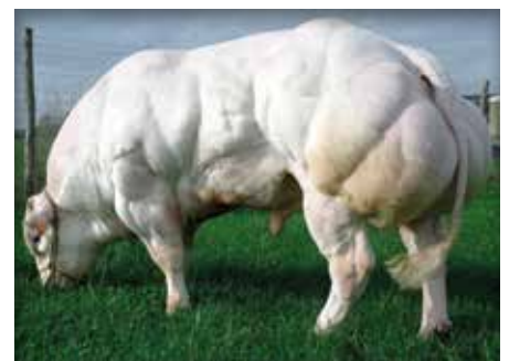
FACHO du Fond de Bois