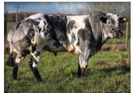
COCA du Coin