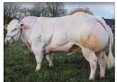
FARKOUM de Centfontaine