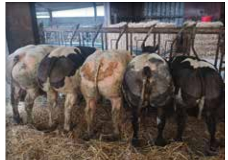
Lot chez/bij Plainchamps Joachim, Bellefontaine