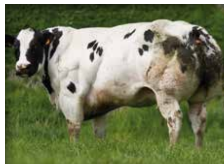
HISTORY de Mahoney