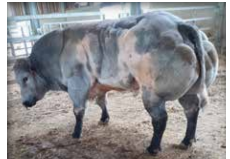
TIRET du Rivage

Tiret komt uit de kudde en is een complete stier die heel gemakkelijk in gebruik is. Castor du Moligna is de volle broer van Cactus du Moligna, Nationaal kampioen van 1434 kg. De kalveren bij de verkoper zijn heel gemakkelijk in opfok en veelbelovend.