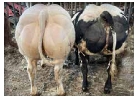
Lot chez / bij Rouxhet J-F, Izier