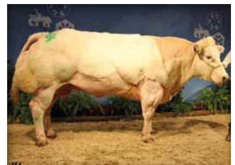
CHIQUITA van het Bareelhof