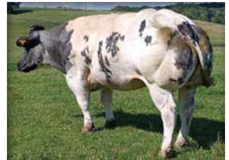
GUIRLANDE de Biert

Zoon van Touffu de la Grande Rose met een uitstekende moederlijn. Zijn grootmoeder was een heel goede en zware dochter van de gekende Elisa en zijn moeder is één van de beste koeien van de fokker. Jour is een brede stier zowel in de voor- als in de achterhand met een mooie schouder.