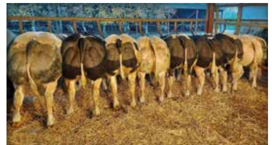
Lot chez / bij Monfort J-P & Quentin, Les Avins