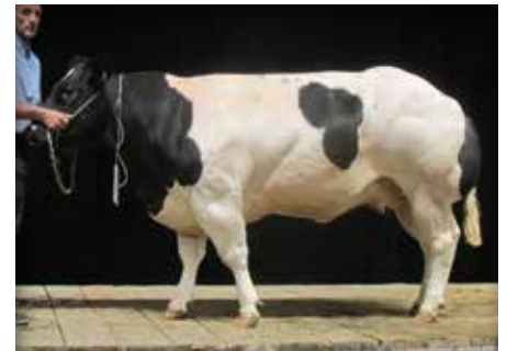
JOCONDE du Garnel