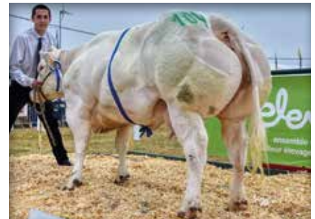
CAGNOTTE de Centfontaine