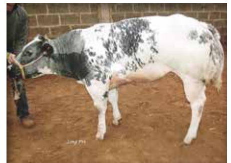
PANAMA des deux Bouleaux, championne à / kampioene van Warchin 2013