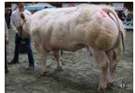
LICORNE de la Ferme des Croix