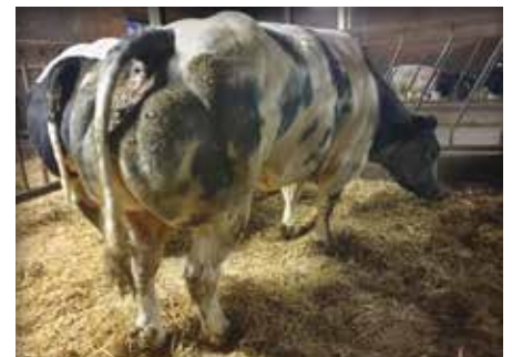
LOLITA van de Stokerij