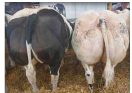
Lot à / in Libramont 2022