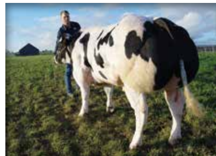
IMITE de Maffe, demi-frère de / halfbroer van Apparat

Deze zoon van Acajou de Sberchamps is een stier met veel gestalte en gewicht en heeft een interessante bloedvoering. Zijn overgrootmoeder Discrète de Maffe is de volle zus van Féodale en Précieuse de Maffe. Zijn lengte, type en zijn kleur maken van hem een interessante stier..