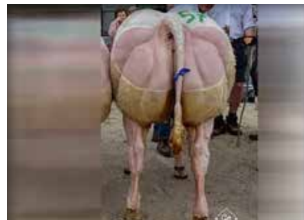
NEIGE de Mahoney