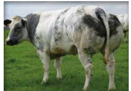
BRICOLE du Fond de Bois