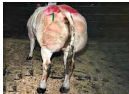
Discrète de Maffe

ACAJOU de Sberchamps 78 • 90,2 • 86,3 • 88 • 85 • 88,8