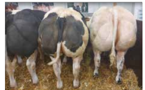
Lot à / in Libramont 2022

Brillant werd zowel kampioen op de winterprijskamp in Libramont 2019 als op de keuring van Herock een paar maanden later, hij is overal breed en rond, hij is een echte raceur! Zijn moeder en grootmoeder zijn allebei heel goede fokkoeien met veel gestalte. Zijn nakomelingen onderscheiden zich al op de regionale en provinciale prijskampen.