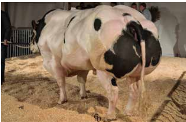
Couleur palettes - Kleur rijsjes saumon-zalm