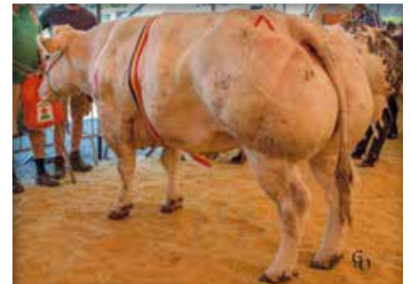
VICTOIRE de Centfontaine

1ste zoon van Dauphin op een KI, zijn grootmoeder Victoire de Centfontaine werd kampioen in Clavier. Farkoum is een lange stier met veel finesse en goed beenwerk